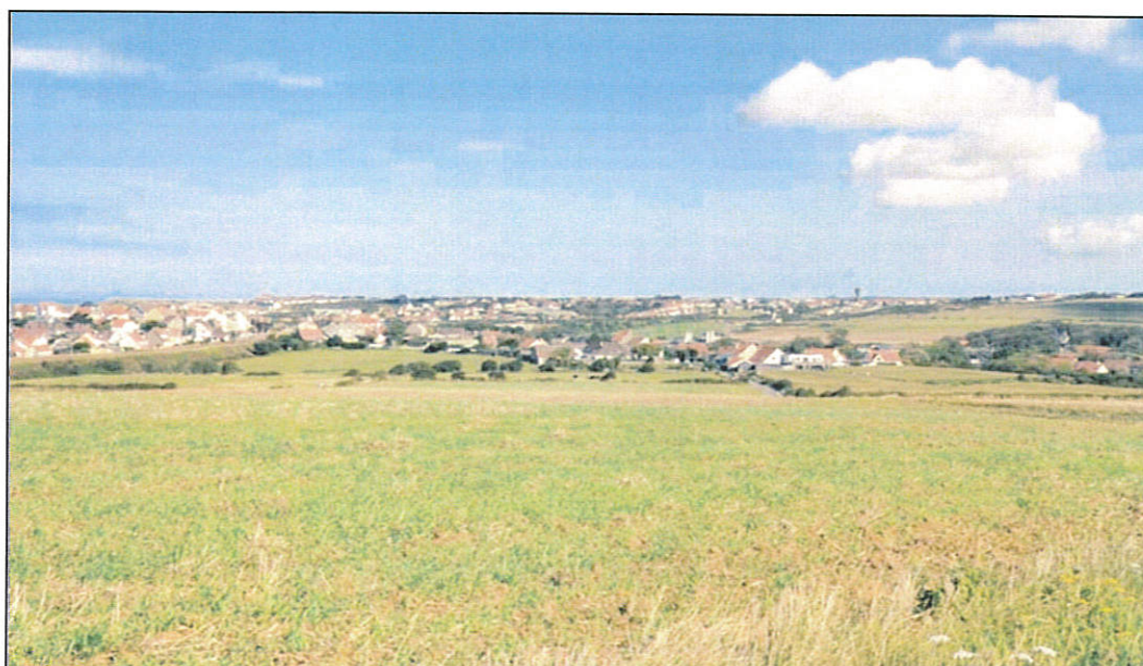
Enquête publique Unique Projet d'aménagement de la zone d'aménagement concerté (ZAC) d'Auvringhen sur le territoire de la commune de Wimille